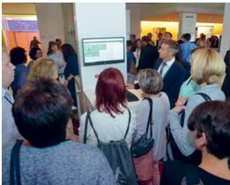
Dicht belagerte Stände.

Das für 16 Uhr geplante (offizielle) Ende der eXPO wurde kurzerhand etwas nach hinten ver-