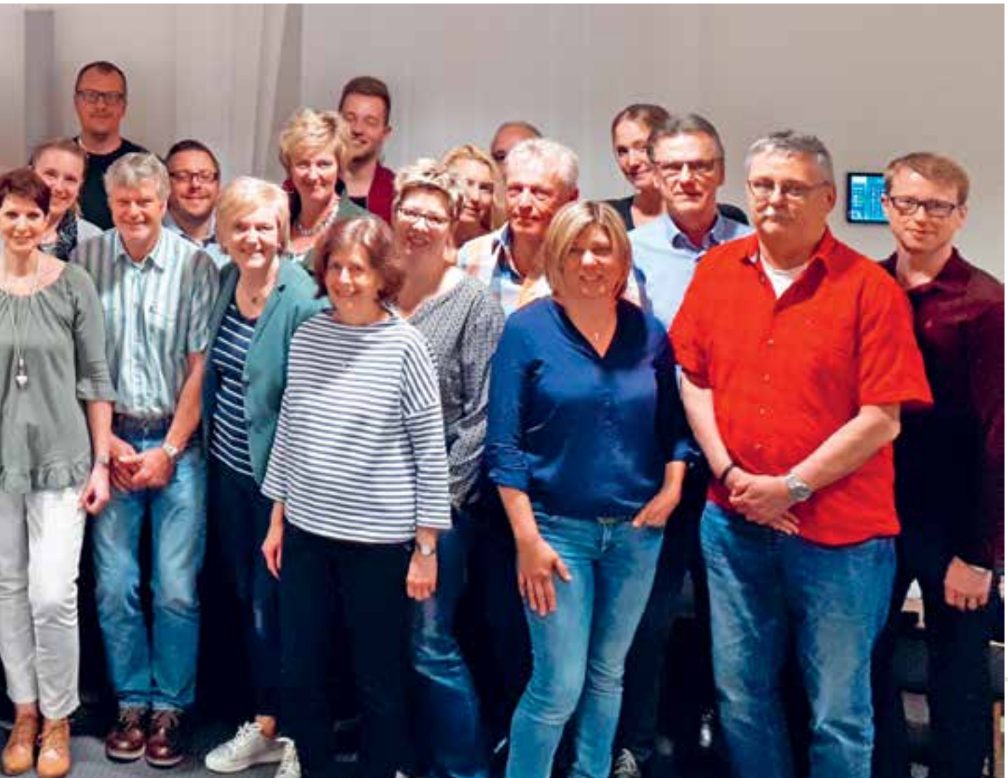
Die Teilnehmer des 39. Anwendertreffens

teren innovativen Systeme für den HR-Bereich fanden großes Interesse. P&I Doku3 ist z. B. ein Modul, das Dokumente erzeugt und flexible Funktionen zur Verwaltung von Korrespondenzen bereitstellt.