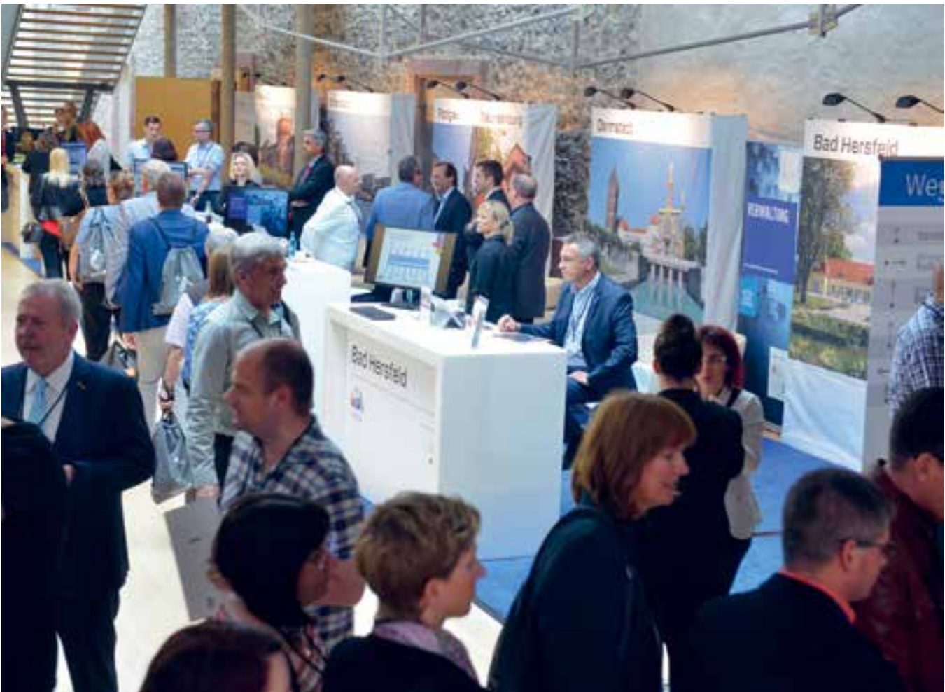
Die Sonderausstellung widmete sich sechs ausgewählten Kommunen mit herausragenden IT-Projekten.